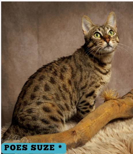
POES SUZE *