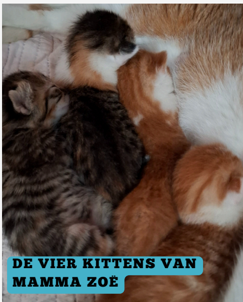
DE VIER KITTENS VAN MAMMA ZOË