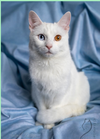
Poes Mauro *

Momenteel zijn er geen kittens of poezen beschikbaar voor adoptie