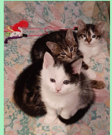
Kittens Carlos, Chico en Clem